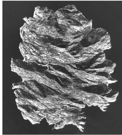
Inquadramento attuale su C.R.T.