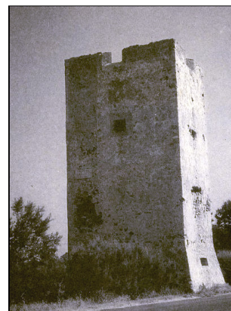
la torre oggi