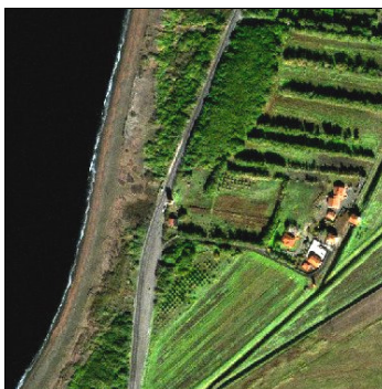
foto aerea dell'area